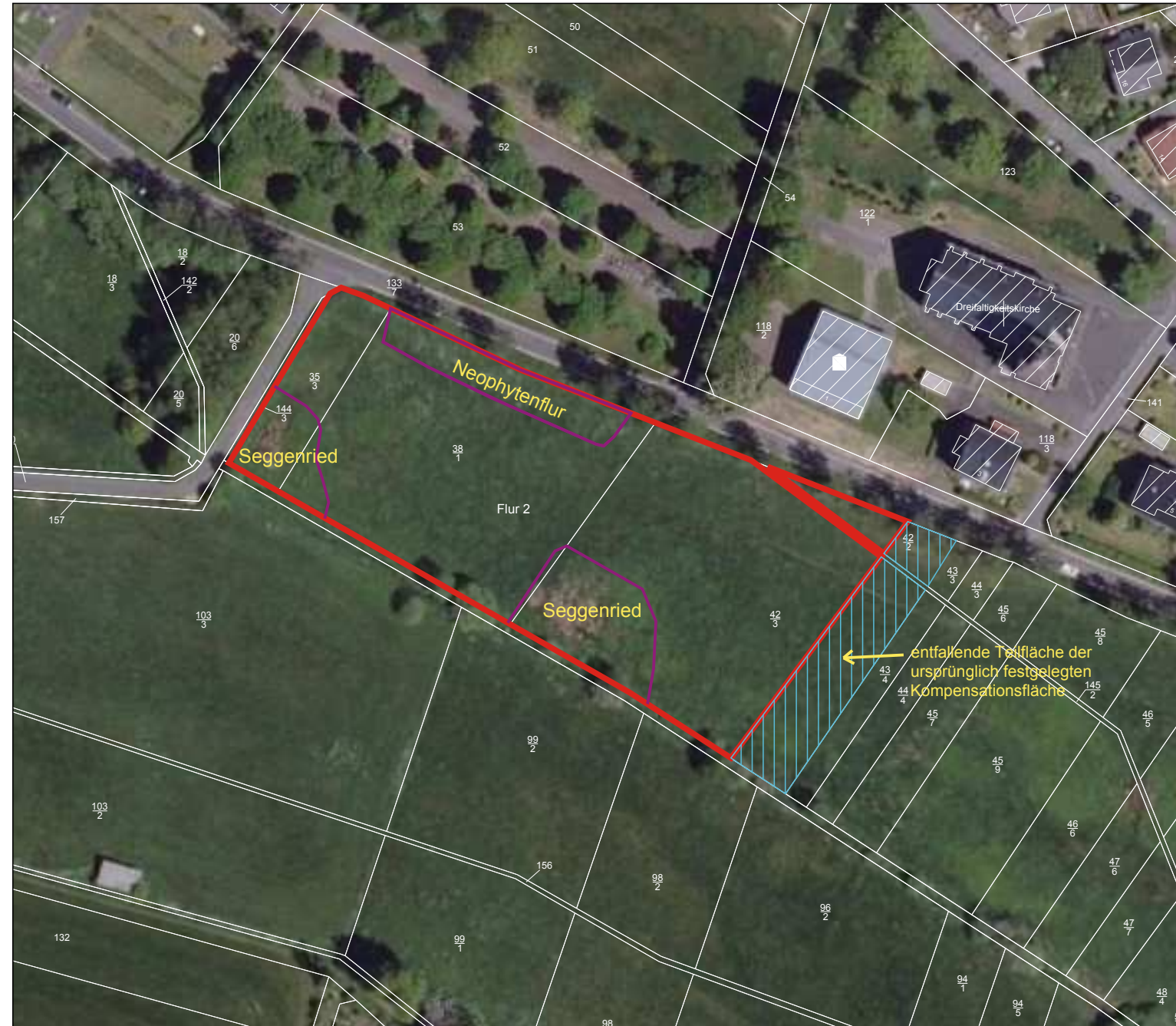
Gemarkung Kausen, Flur 2, Flurstücke 35/3, 38/1, 42/2 tlw., 42/3 tlw.